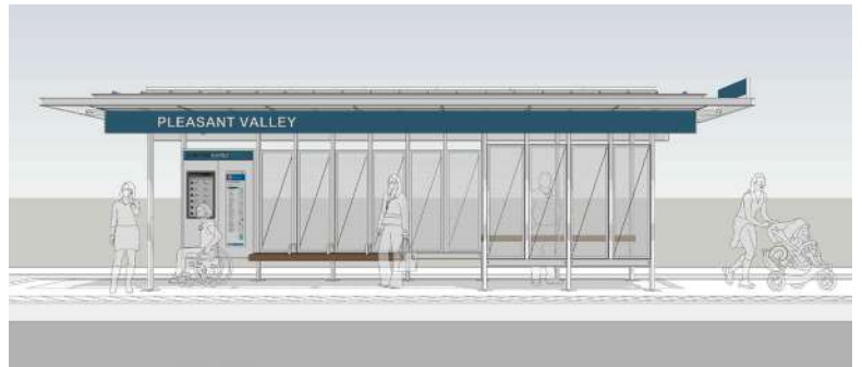
Representación conceptual de un artista

En nuestra comunidad existe una pasión compartida por el medio ambiente, y el plan de Project Connect incluye la transición de la flota de Capital Metro a vehículos sin emisiones. En 2021, Capital Metro hizo el mayor pedido de la historia de una flota de autobuses eléctricos. Los nuevos vehículos eléctricos están dotados de la más moderna tecnología, ingeniería y comodidades para el cliente, como puertos de carga USB, recarga desde el techo y con enchufe, plano de asientos abierto y pantallas digitales para ofrecer a los clientes comunicaciones claras y oportunas.