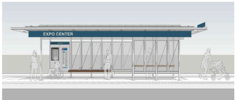
Representación conceptual de un artista